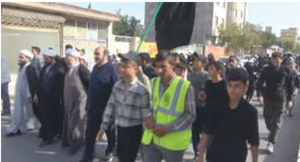
کاروان های پیاده در مسیر مشهدالرضا(ع)