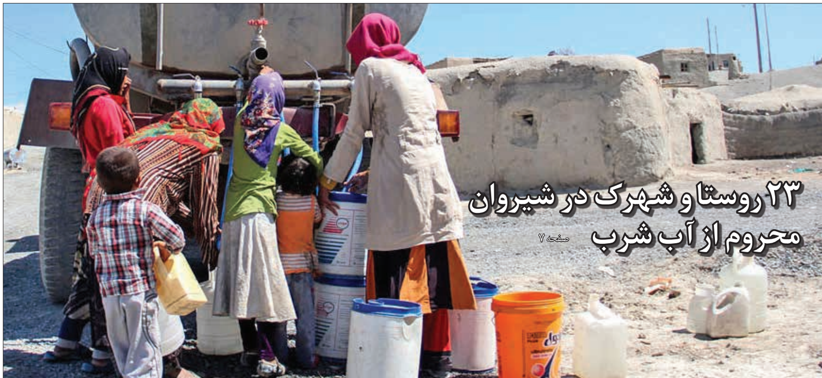
۲۳ روستا و شهرک در شیروان محروم از آب شرب