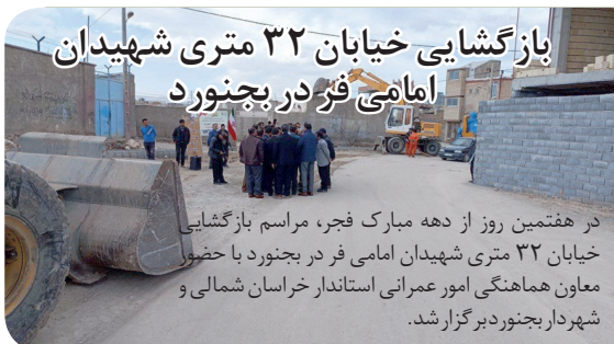
بازگشایی خیابان ۳۲ متری شهیدان امامی فجر در بجنورد

در هفتمین روز از دهه مبارک فجر، مراسم بازگشایی خیابان ۳۲ متری شهیدان امامی فر در بجنورد با حضور معاون هماهنگی امور عمرانی استاندار خراسان شمالی و شهردار بجنورد برگزار شد.