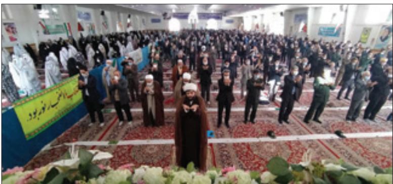
آیین عبادی، سیاسی نماز جمعه روز گذشته در شیروان