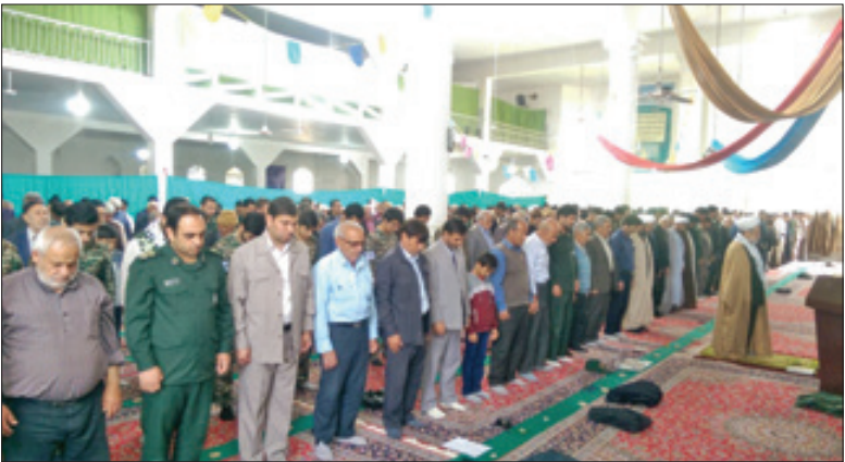
آیین عبادی، سیاسی نماز جمعه روز گذشته در آشفخانه

آیت ا... یعقوبی: مسئولان به منظور تعیین مکان مناسب برای ارتش همکاری کنند