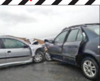
تصادف ۲ خودرو در محور بجنورد به اسفراین