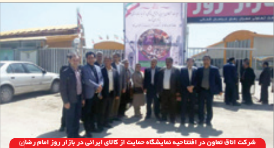
شرکت اتاق تعاون در افتتاحیه نمایشگاه حمایت از کالای ایرانی در بازار روز امام رضا(ع)