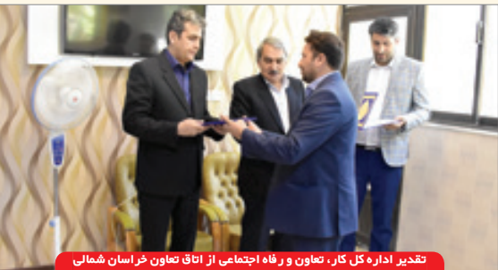
تقدیر اداره کل کار، تعاون و رفاه اجتماعی از اتاق تعاون خراسان شمالی

و ترکمنستان ادامه داد: یکی دیگر از علل رکود برخی تعاونی ها اختلافات میان اعضا عنوان می شود که درصد ناچیزی از رکود را در برمی گیرد و غالباً با راهنمایی گرفتن از واحدهای مشاوره اتاق های تعاون و ادارات کل تعاون استانی این مشکل به سرعت برطرف می شود، تحصیلات کم اعضا نیز