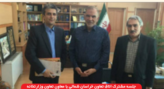
جلسه مشترک اتاق تعاون خراسان شمالی با معاون تعاون وزارتخانه