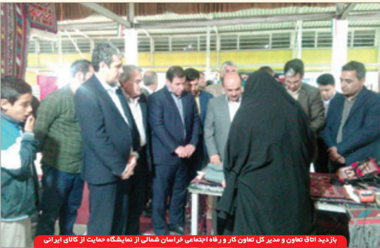
بازدید اتاق تعاون و مدیر کل تعاون کار و رفاه اجتماعی خراسان شمالی از نمایشگاه حمایت از کالای ایرانی

وی اضافه کرد: فعالان بخش تعاون بر این باورند که ریشه بسیاری از ناکامی های بخش تعاون ناشی از نبود فرهنگ تعاون در کشور، نگاه تبعیض آمیز نسبت به فعالیتهای بخش خصوصی و تعاونی، عدم کاهش تصدی گری های دولتی، نبود فضای رقابت و صادرات و عدم حمایت و اعتماد نظام بانکی به تعاونی ها است.