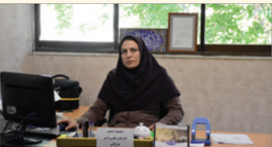
جلسه مشترک اتاق تعاون خراسان شمالی با معاون تعاون وزارتخانه