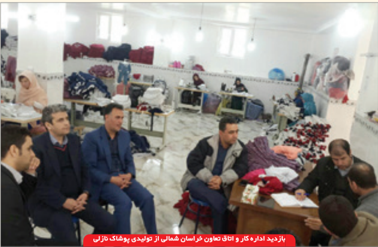
بازدید اداره کار و اتاق تعاون خراسان شمالی از تولیدی پوشاک نازلی

این دسته تعاونی ها و در واقع رکود آنها بوده است، برخی از تعاونی های غیرفعال به دلیل نوع کاربری صرفه اقتصادی ندارند که با ارائه مشاوره های لازم امکان تغییر کاربری و احیای دوباره را به دست می آورند، وی افزود: امروز تعاونی ها نقش مؤثر و ارزشمند خود را در بسیاری از ماموریت های کلان در صد کمی از علل ناکارآمدی تعاونی ها را موجب می شود. وی با بیان این که در سال های اخیر به دلیل عدم حمایت بانکی، نبود نقدینگی و سرمایه در گردش برخی از تعاونی ها در سراسر کشور رکود قرار گرفتند که شاید بتوان گفت عامل اصلی غیرفعال بودن