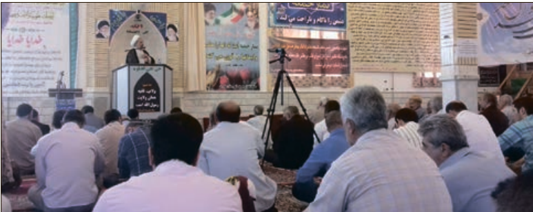
آیین عبادی، سیاسی نماز جمعه روز گذشته در گر مه