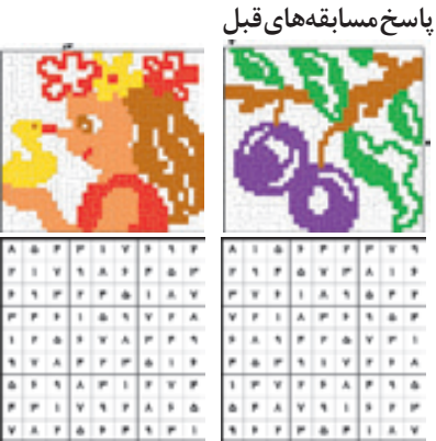
پاسخ مسابقه های قبل

به صفحه راهنما می روید و تعداد بیشتری از چارچوب ها برای تان کشف می شود. توصیه ما این است که نقش یاب چارچوب را خانوادگی حل کنید. لذت بخش بودن حل گروهی این معما، باعث شده که ما آن را در صفحه پنجشنبه قرار بدهیم تا تمام اعضای خانواده، در روز تعطیل آخر هفته، فرصت داشته باشند کنار هم باشند و تصویر نهفته در این معما را کشف کنند. شنبه نتایج قرعه کشی این هفته اعلام می شود و حل کردن سرگرمی های منطقی امروز، آخرین فرصت کسب امتیاز برای افزایش شانس در قرعه کشی است. موفق و پیروز باشید و حرفه ای