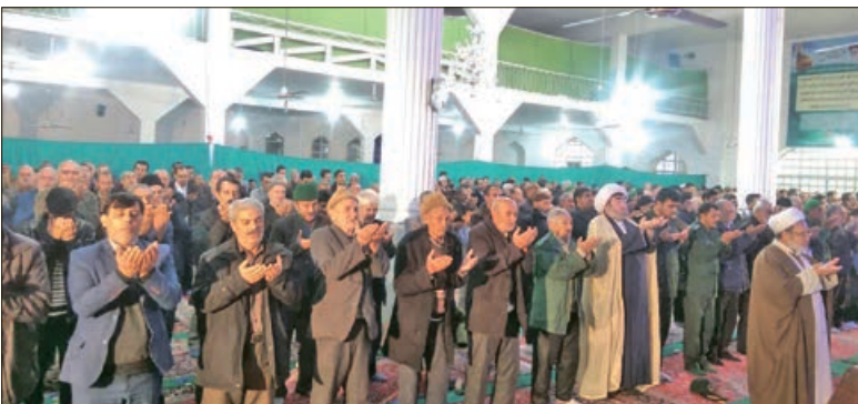
آیین عبادی، سیاسی نماز جمعه روز گذشته در آشنخانه

وی با بیان این که در جریان ۲۲ بهمن که جشن بزرگ ملی ماست جریان هایی از بیرون از کشور برنامه ریزی می شوند، تصریح کرد: این انقلاب امانت شدها و امام (ره) است و همه باید پاسدار خون شهدا و انقلاب باشیم و اگر رعایت کردیم چه بهتر و گرنه بچه انقلابی ها از رهبر یک جمله یاد گرفتند؛ آتش به اختیار و کسی این آتش به اختیارها را نمی تواند کنترل کند و امیدواریم کار