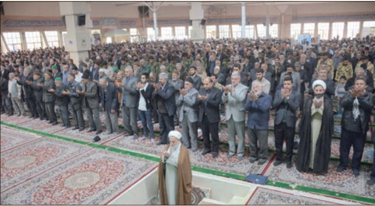
آیین عبادی، سیاسی نماز جمعه روز گذشته در بجنورد