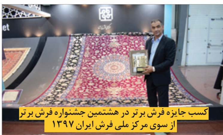
کسب جایزه فرش برتر در هشتمین جشنواره فرش برتر از سوی مرکز ملی فرش ایران ۱۳۹۷