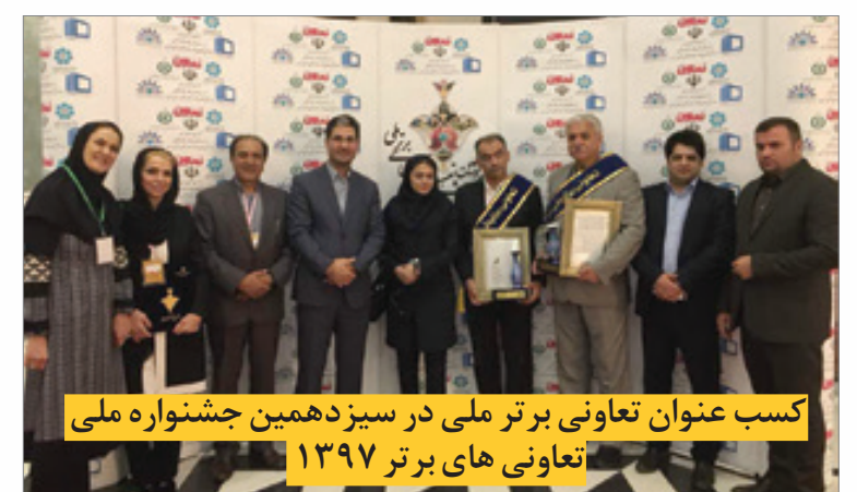
کسب عنوان تعاونی برتر ملی در سیزدهمین جشنواره ملی تعاونی های برتر ۱۳۹۷