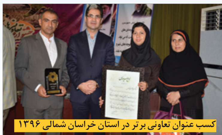
کسب عنوان تعاونی برتر در استان خراسان شمالی ۱۳۹۶