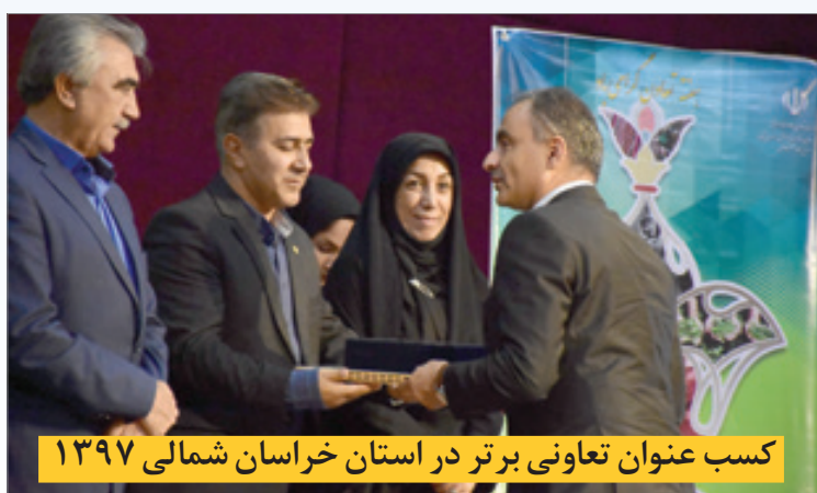
کسب عنوان تعاونی برتر در استان خراسان شمالی ۱۳۹۷