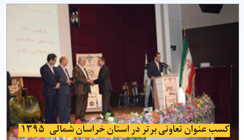
کسب عنوان تعاونی برتر در استان خراسان شمالی ۱۳۹۵