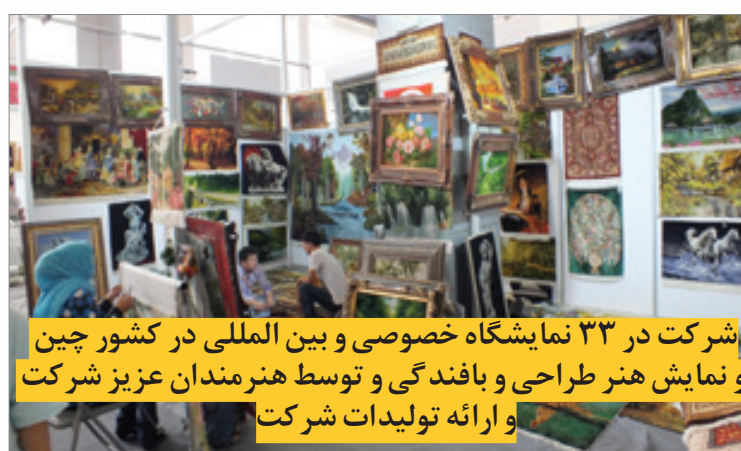
شرکت در ۳۳ نمایشگاه خصوصی و بین المللی در کشور چین و نمایش هنر طراحی و بافندگی و توسط هنرمندان عزیز شرکت و ارائه تولیدات شرکت