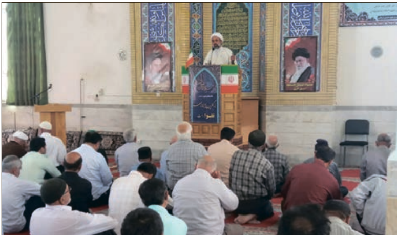
آیین عبادی، سیاسی نماز جمعه و روز گذشته در درق