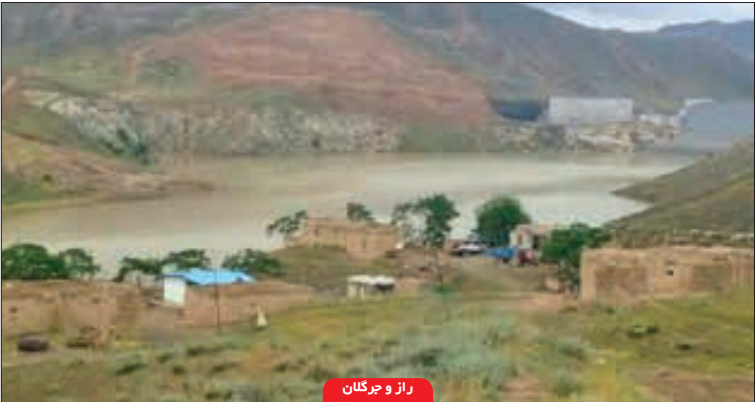
راز و جرگلان

نجفیان - رئیس اداره راهداری و حمل و نقل جاده ای اسفراین میزان خسارت سیلاب به راه های روستایی این شهرستان را بیش از ۲ میلیارد و ۶۰۰ میلیون ریال اعلام کرد.«ذاکری» با اشاره به این که در پی بارندگی های روزهای اخیر مسیر آنتنی روستاهای عنبرآباد و گپژ، محور روستایی آقچ-