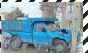
تصادف نیسان با دوچرخه میدان امام حسین(ع) بجنورد