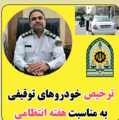
ترخیص خودروهای توقیفی به مناسبت هفته انتظامی

رئیس پلیس راهور استان خراسان شمالی از ترخیص خودروهای توقیفی به مناسبت هفته فراجا خبر داد. سرهنگ «هادی پرویزیان» در گفت و گو با خبرگزاری پلیس اظهار داشت: بنا بر تدبیر فرمانده کل انتظامی، وسایل نقلیه ای که در چارچوب مقررات پلیسی، توقیف فیزیکی شده و در پارکینگ می باشند به مناسبت هفته انتظامی ترخیص می شوند. سرهنگ «پرویزیان» تاکید کرد: البته این طرح، مشمول خودروهایی که دارای شکایت قضایی و پرونده مفتوح در سیستم قضایی هستند، نمی شود. جانشین پلیس استان گفت: متقاضیان می توانند برای ترخیص خودروی خود به دفاتر پلیس ۱۰+ در سراسر کشور یا به اپلیکیشن «پلیس من» در بخش «پلیس راهور» مراجعه و نسبت به انجام فرآیند ترخیص خودروی خود اقدام نمایند.