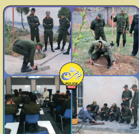
اطلاعیه معاونت وظیفه عمومی فرماندهی انتظامی خراسان شمالی در خصوص اشتغال زایی

بدینوسیله به اطلاع آن دسته از کارکنان وظیفه منقضی خدمت نیروهای مسلح که از تاریخ پایان خدمت آنان بیش از ۵ سال نگذشته و زیر ۵ سال باشند با شرایط داشتن مدارک (گواهینامه مهارت آموزی معتبر صادره از نهادهای دولتی و... یا مدارک فارغ التحصیلی مرتبط با طرح های پیشنهادی) می توانند با مراجعه به سامانه «سزا» نسبت به ثبت نام خود اقدام نمایند.