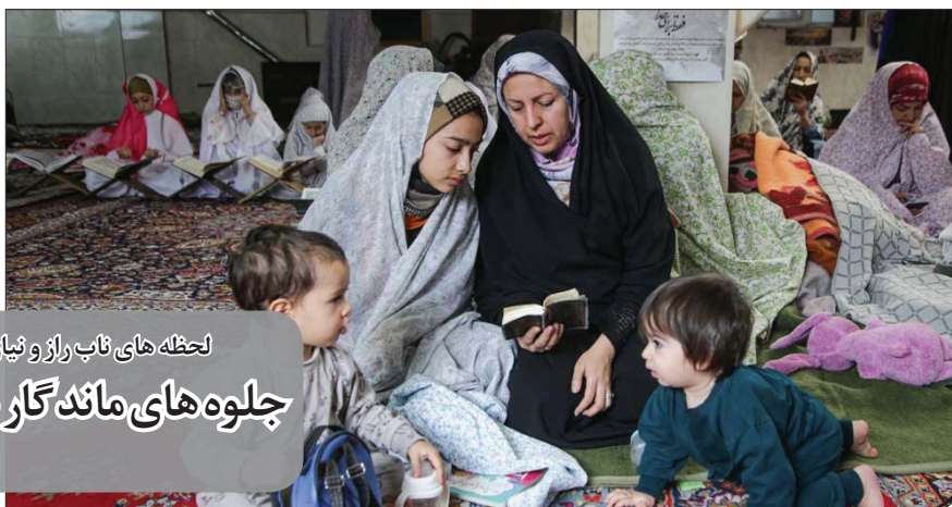
لحظه های ناب راز و نیاز و نیایش