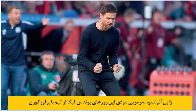
ژابی آلونسو؛ سرمربی موفق این روزهای بوندس لیگا از تیم بایرلورکوزن