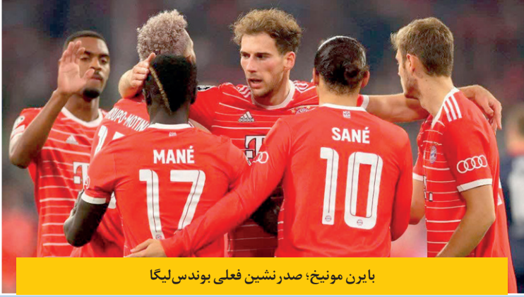
بایرن مونیخ؛ صدر نشین فعلی بوندس لیگا