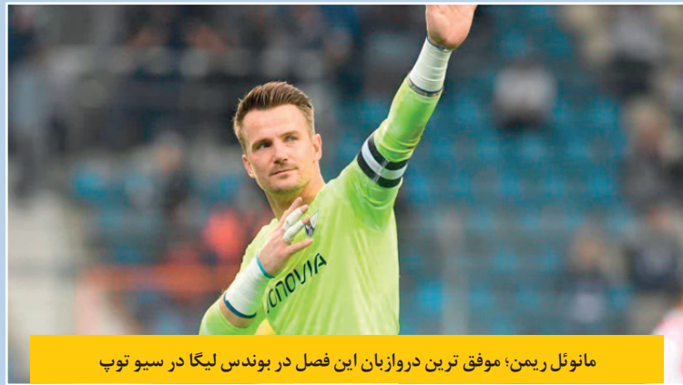
مانوئل ریمن؛ موفق ترین دروازه بان این فصل در بوندس لیگا در سبو توپ