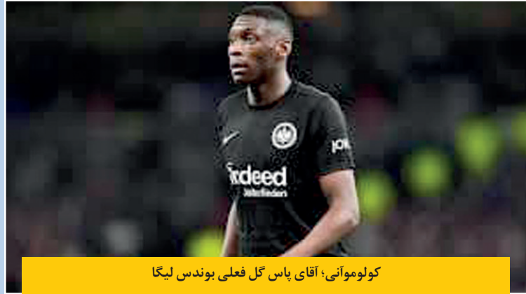
کولوموآنی؛ آقای پاس گل فعلی بوندس لیگا