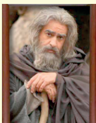
شمس تبریزی | شهاب حسینی | فیلم سینمایی «مست عشق»

وقتی خبر تولید فیلم سینمایی «مست عشق» رسانه‌ای شد، خیلی‌ها منتظر بودند تا ببینند انتخاب «حسن فتحی» برای نقش «مولانا» چه کسی است. وقتی نام «پارسا پیروزر» به عنوان بازیگر نقش «مولانا» معرفی شد، شاید خیلی‌ها نسبت به این انتخاب مردد بودند، اما با انتشار عکس‌های تست گریم او انگار هنر‌نمایی او در این نقش پذیرفتنی شده است. این فیلم طبق گفته تهیه‌کننده آن قرار است مهر امسال اکران شود و باید تا زمان رونمایی از این فیلم منتظر ماند و دید که «پیروزر» چقدر در ایفای نقش مولانا موفق بوده است.