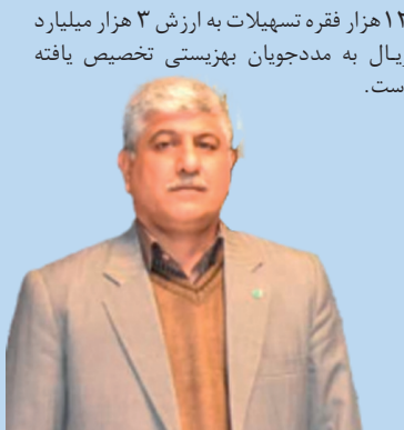
۱۲ هزار فقره تسهیلات به ارزش ۳ هزار میلیارد ریال به مددجویان بهزیستی تخصیص یافته است.

در دیدار صمیمانه جمعی از اهالی علم، ادب، شعر و قلم مطرح شد :