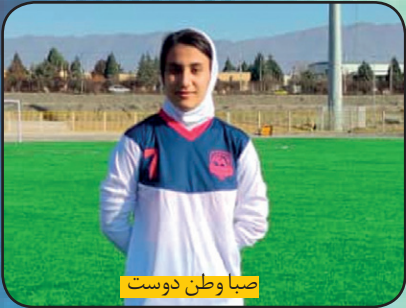
صبا وطن دوست