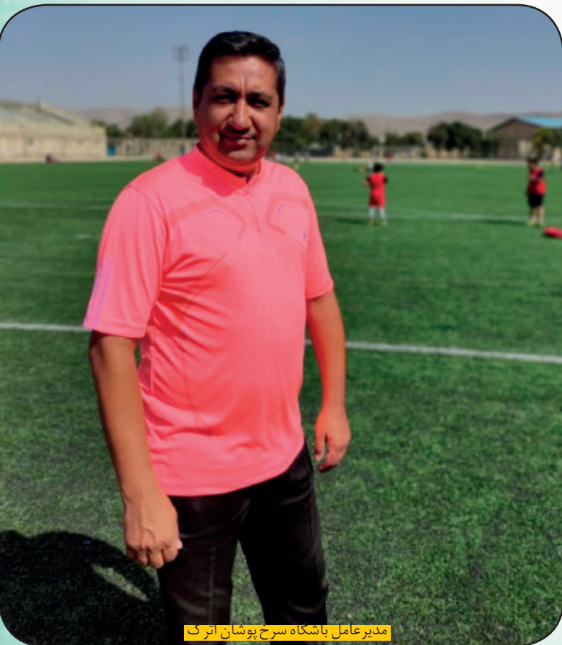
مدیرعامل باشگاه سرخ پوشان اترک