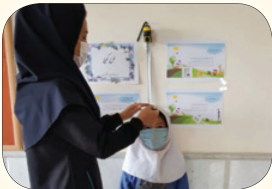
سنجش قد و وزن دانش آموزان در فرایند پروژه کنرل وزن و چاقی (کوچ)