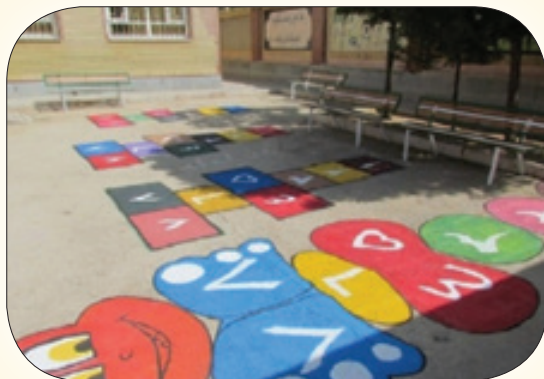
مدرسه پویا و کلاس درس تربیت بدنی