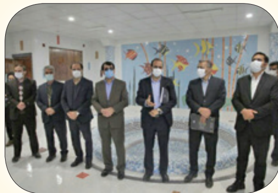
احداث استخر دانش آموزی

مقام دوم کشور در جشنواره تولید محتوا برای اجرای درس تربیت بدنی و فعالیت های ورزشی در منزل