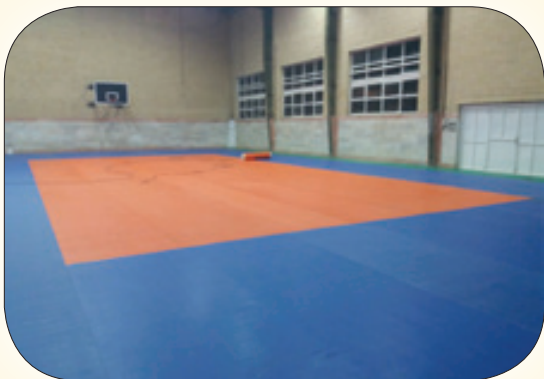
تعویض و بهسازی کفپوش سالن ورزشی حصار گرمخان