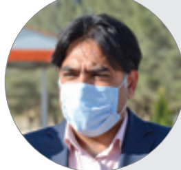
رئیس کمیسیون فرهنگی شورای اسلامی شهر شیروان