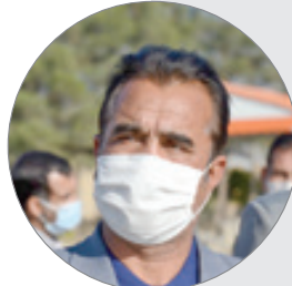
رئیس شورای اسلامی شهر شیروان