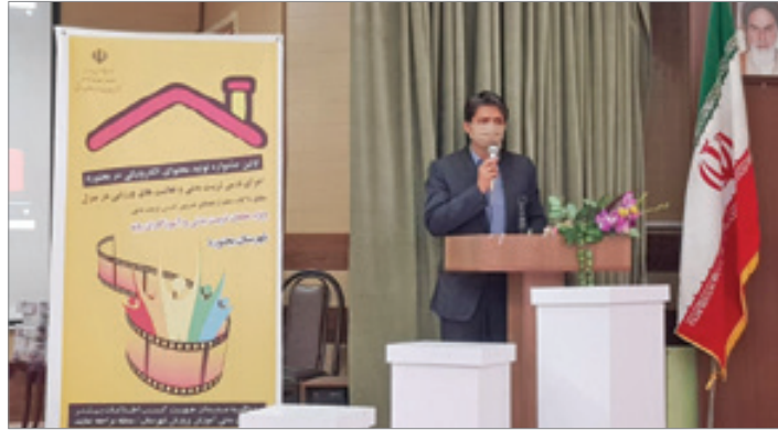
پخش برنامه های ورزشی فیلد امرا در منزل از شبکه تلویزیونی استان