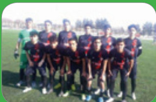
تیم پدیده ماهان بجنورد میزبان مسابقات امیدهای مناطق کشور

به گفته جعفر زاده ۱۶ مدرسه فوتبال و فوتسال در استان داریم که دارای مجوز هستند، ۱۴ مدرسه فوتبال و ۲ مدرسه فوتسال در استان فعال هستند و نظارت های محسوس و نامحسوس نیز به منظور تأیید مربیان دارای مدرک معتبر، تجهیزات و امکانات، استاندارد مدارس، تغذیه و سرویس های رفت و برگشت و کارت های بیمه و ... انجام می گیرد.