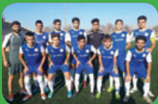
تیم امید استقلال نوین بجنورد در لیگ دسته اول امید های کشور