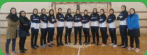
تیم کیمیای اسفراین در لیگ دسته یک فوتسال کشور