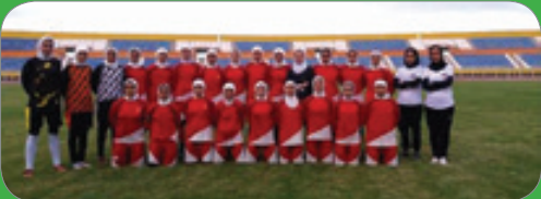
تیم فوتبال اترک سرخپوشان لیگ دسته یک فوتبال کشور