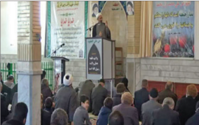
آیین عبادی، سیاسی نماز جمعه روز گذشته در گرمه