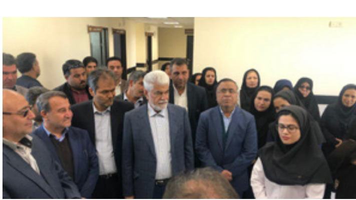
بازدید و افتتاح رسمی مرکز خدمات جامع سلامت زنده یاد احمد طلاچیان شهر زیارت