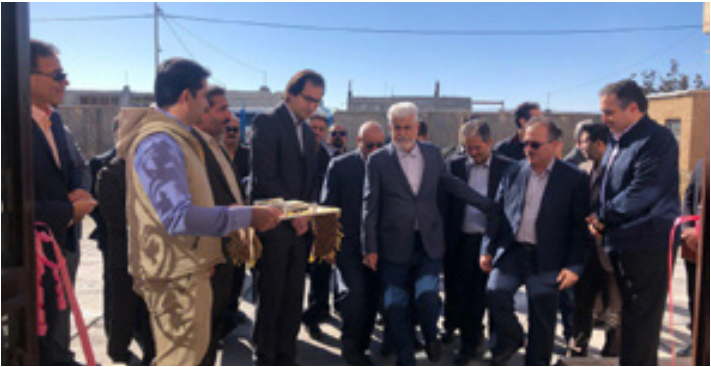
آیین افتتاح مرکز خدمات جامع سلامت روستایی دوبین