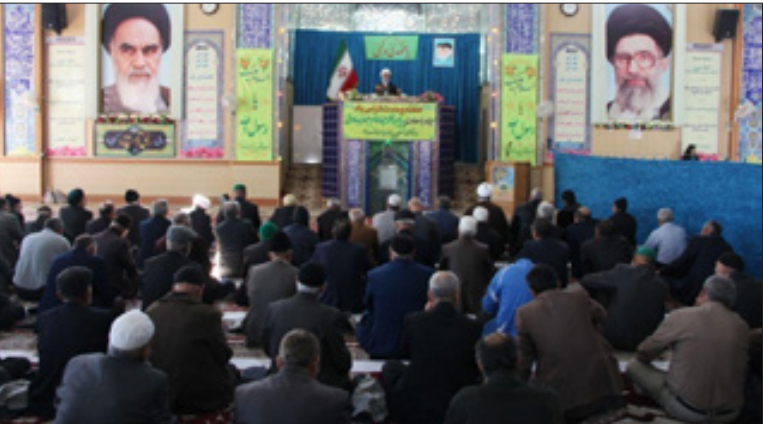
این عبادی، سیاسی نماز جمعه روز گذشته در شیروان