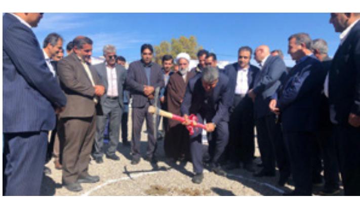
آیین کلنگ زنی پایگاه سلامت و اورژانس ۱۱۵ جواد الائمه (ع)